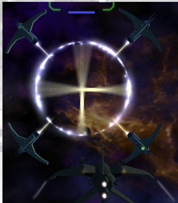
Bild: Manipulierter Handelsroutenring bei New London

So wurde erst gestern ein Fall bekannt, bei dem ein Handelsroutenring von hinterhältigen Zeitgenossen so manipuliert worden ist, dass durchfliegenden Schiffen Teile der Flügel und des Antriebs abgetrennt wurden.